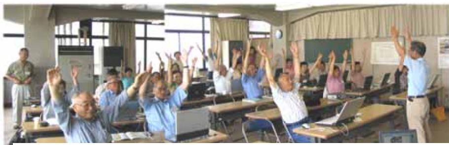
パソコンを楽しみながら、勉強の合間に健康体操午前の部(午後は別会員で同)

NPO法人豊齡研ITサロン会津は「わいわいがやがや楽しみながら、パソコンとインターネットにふれあう仲間のパソコン自遊楽校です。上記内容で、会津若松市中央公民館にて開催します。興味のある方は何時でもお出でください。年会費 一〇,〇〇〇円(年途中参加月割)、他に教材、資料、運営費は、別組織ITサロン愛好会の会員になっていただき、必要な経費を自分たちで月一回でも参加できる会員の方々に月二千元の協力をお願いし運営しています。