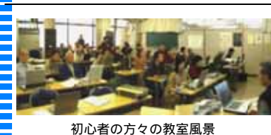
初心者の方々の教室風景