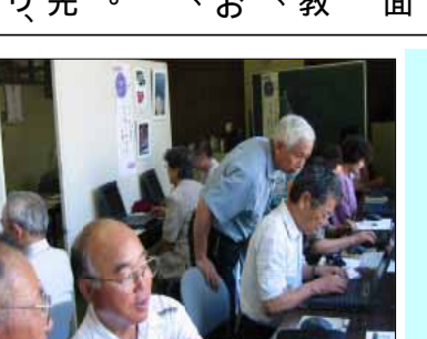
これは...このころの豊研研会員の皆さん

しかし、現実さにはあらず。たかがパソコンされどパソコンです。私の思いとは裏腹にまったく別の画面が出てきます。