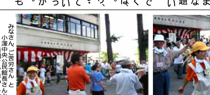
みなさんご苦労さんと小澤中央公民館長さんと豊研研ITサロンのメンバー