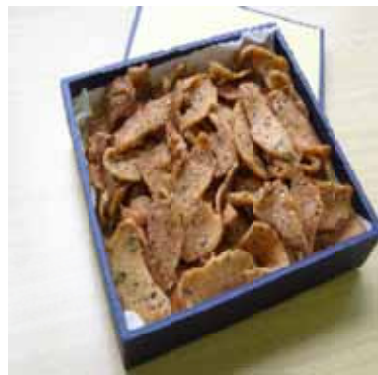
カリントンの作りかた

わたしの小さい頃は、今みたいにおやつにスナック菓子や、チョコレートが有るわけではありませんでした。