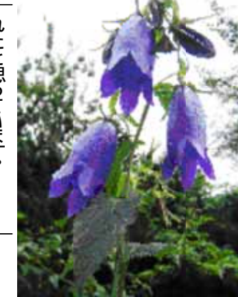
紫萼袋(ムラサキホタル)

数年前から、山野草をデジタルで撮り続けてきました。デジタルで撮るという写真撮ることができない状況でした。それでも最近やっと何とか自分なりに満足